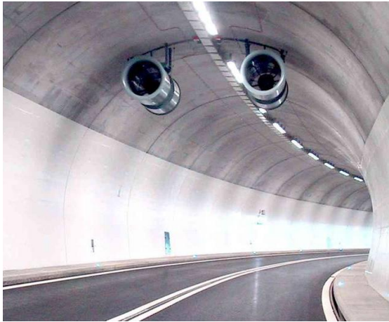
Ispezioni sul luogo

DIRETTIVA 2004/54/CE DEL PARLAMENTO EUROPEO E DEL CONSIGLIO del 29 aprile 2004 relativa ai requisiti minimi di sicurezza per le gallerie della rete stradale transeuropea