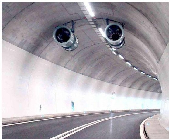
Visite des lieux

Directive 2004/54/CE du parlement européens et du conseil concernant les exigences de sécurité minimales applicables aux tunnels du réseau routier transeuropéen