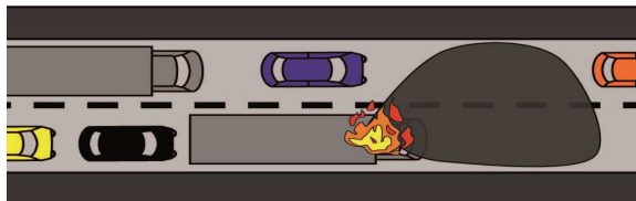
Szenario Brand in einem Richtungsverkehrstunnel