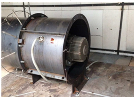
Ventilatore a getto dopo il test di temperatura