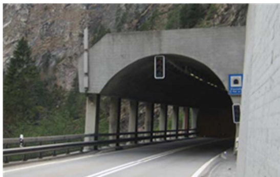
Portale nord Viamala con galleria artificiale