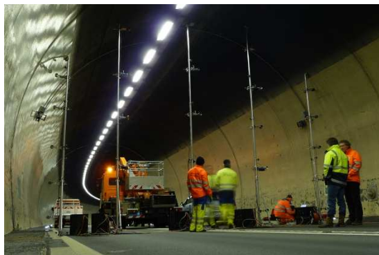
Misurazione di rete per calibratura delle misure di flusso