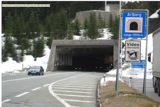
La galleria stradale dell'Arlberg con i suoi 15.516 m di lunghezza è una delle gallerie stradali più lunghe d'Europa