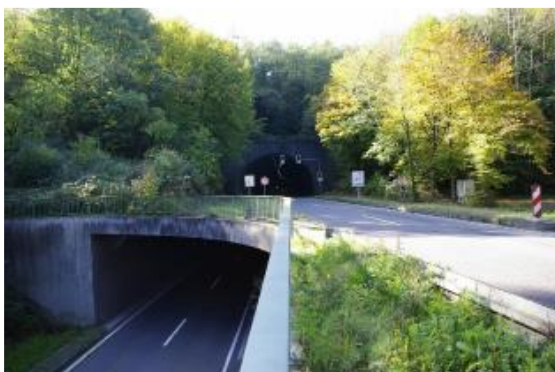
Portali ovest sovrapposti