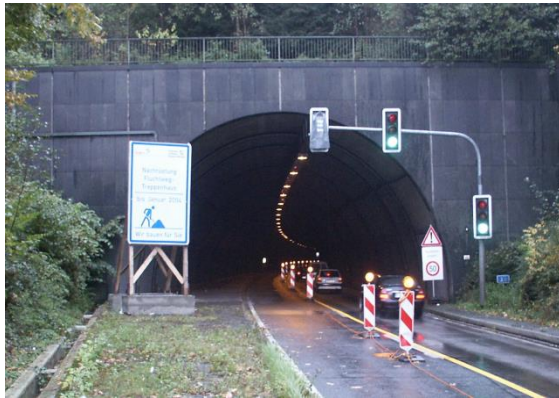
Entrée dans le tube inférieur par le portail Est