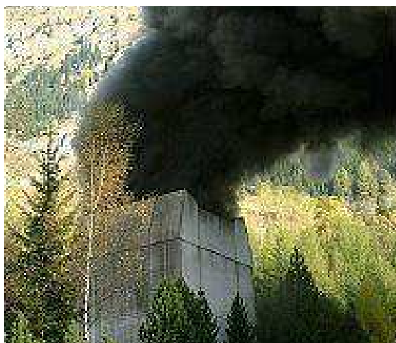
Estrazione dei fumi in caso di evento tramite camino

La possibilità d'incendio in gallerie stradali o ferroviarie deve essere considerata nella fase iniziale della pianificazione. Sulla base di una valutazione dei rischi completa e di una combinazione di misure preventive e d'intervento è importante trovare la soluzione migliore per il progetto in considerazione.