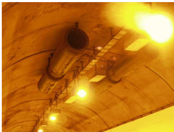
Ventilateurs rayonnants avant assainissement