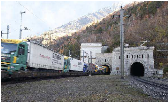
Portail nord du tunnel du Simplon