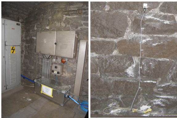
Installation pour le captage de données de mesure (à gauche) dans une galerie transversale et capteur de pression piézographe mural (à droite) dans le tunnel