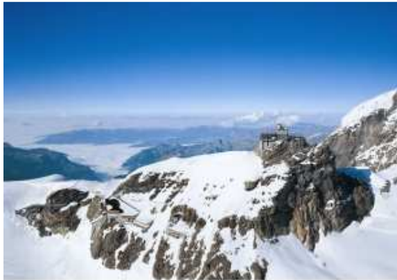
Le Jungfrauoch et sa gare située la plus en altitude d'Europe