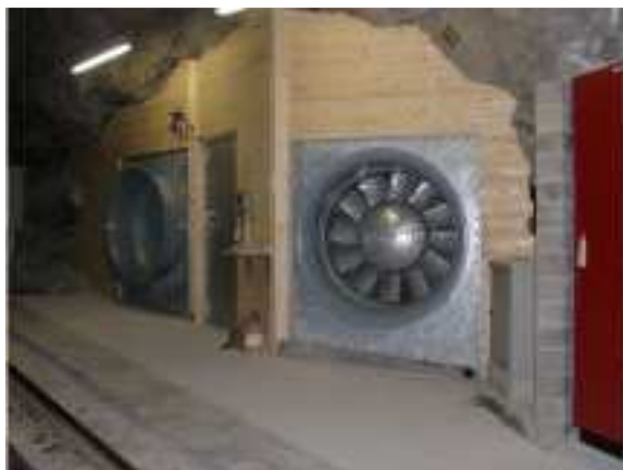
Position d'aspiration des ventilateurs d'évacuation d'air vicié dans le tunnel ferroviaire de la Jungfrau