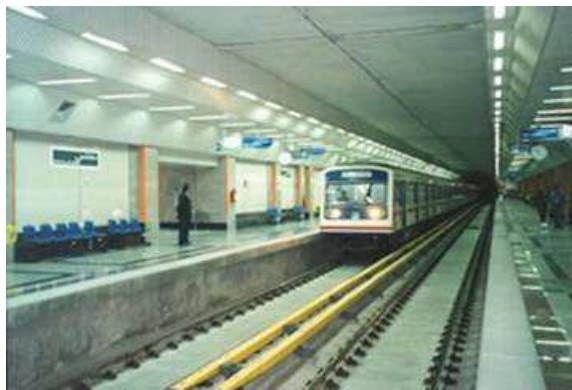
U-Bahnstation mit seitlichen Bahnsteigen (Teheran)