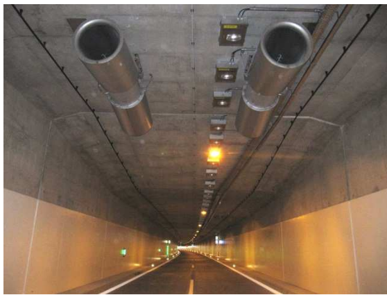
Strahlventilatoren mit um 7° geneigten Schalldämpfern