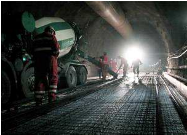
Betonierung der Tunnelsohle unter Einsatz der Baulüftung