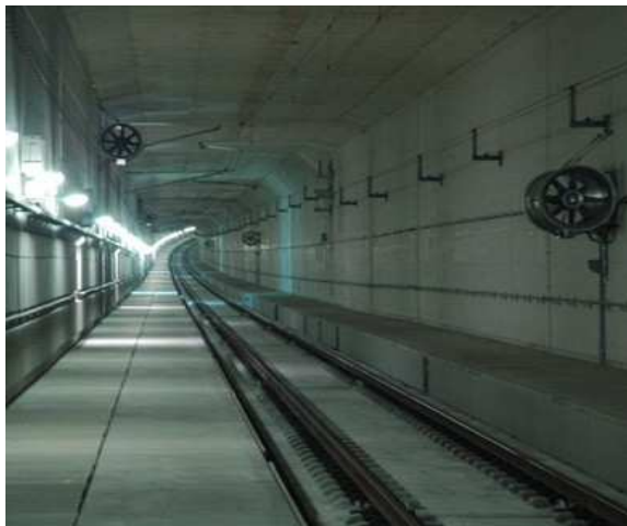
Tunnel Dortdsche Kil